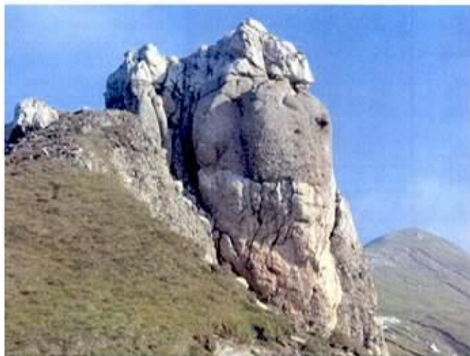
de pe Muntele Omu, numită în popor Stanca Omu și de la care s-a dat numele muntelui. Densușianu, în Dacia preistorică, vorbește despre ea și arată șș poza spunând că îl reprezintă pe Zalmox