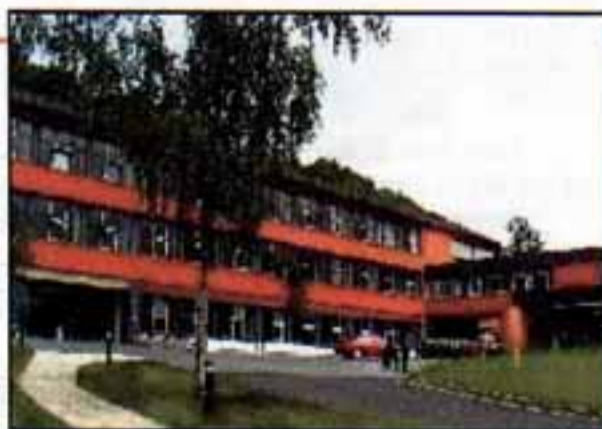
Școala Superioară de Grefieri—Landul Renania de Nord—Westfalia Germania

P.M.: Scopul vizitei pe care o fac aici, în România, poate fi sintetizat în exprimarea ideii de „contravizită”. Am venit la S.N.G ca răspuns la vizita pe care am primit-o de aici, din România, la noi, în Germania, prilejuită de suportul pe care ni l-a oferit IRZ de la Bonn (IRZ este abrevierea pentru Fundația Germană pentru Cooperare Juridică Internațională - n.r.). Această fundație mediază contacte între Germania, pe de o parte, și alte țări, pe de altă parte, țări europene, membre ale UE sau care doresc să devină, IRZ asigurând, totodată, finanțarea acestor contacte.