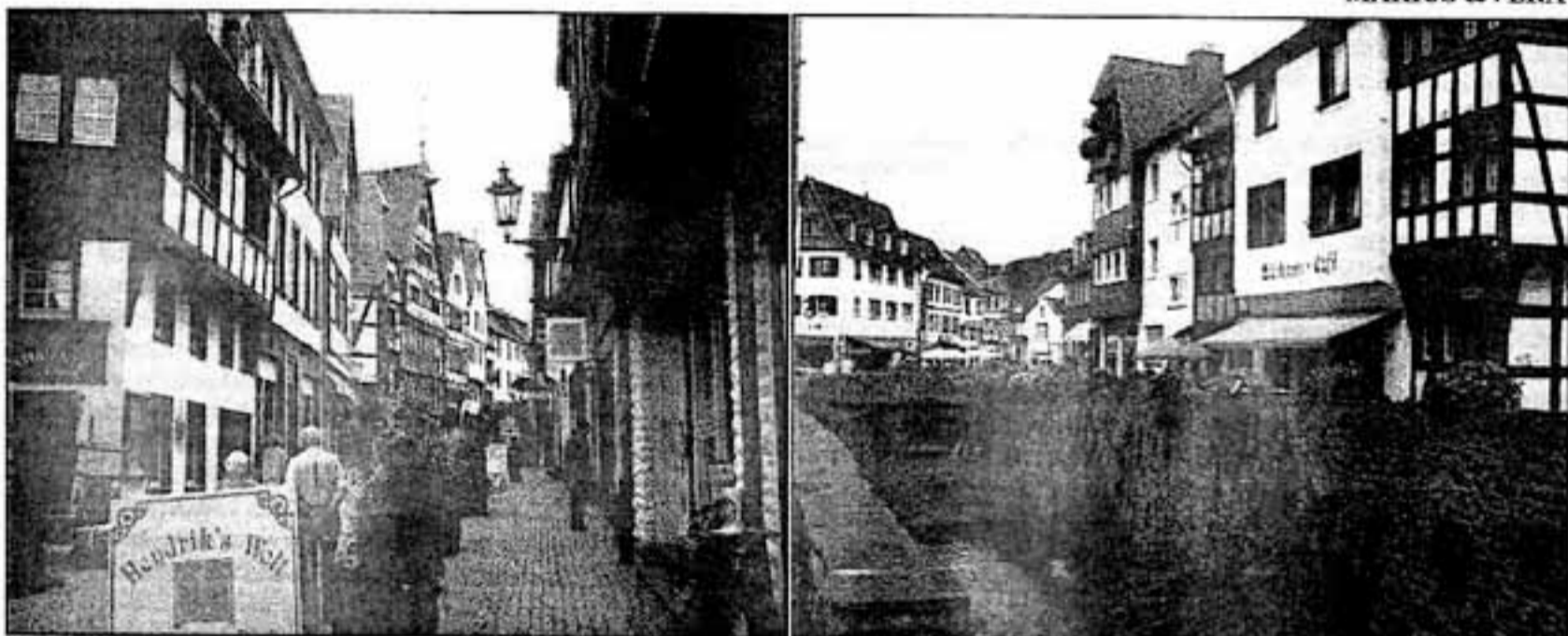
două bucăți din BAD MUNSTEREIFEL , oraș medieval care găzduiește Școala Superioară de Grefier din landul Renania de Nord—Westfallia Germania